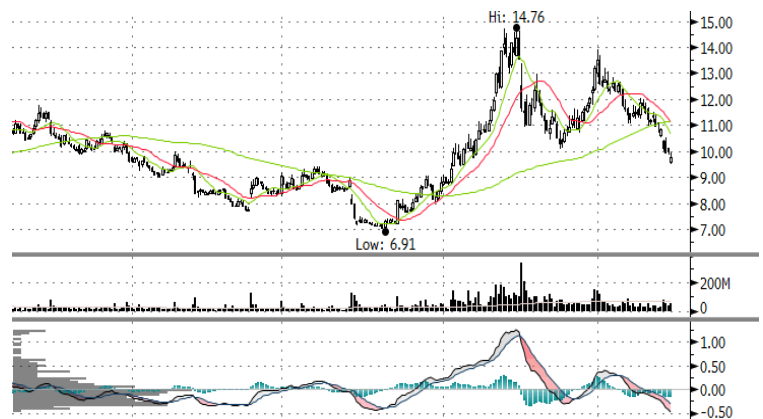
圖 1: 1 年股價圖

展望未來，公司預計 2018 年第一季度收入將按季增長 7%-9%，毛利率介乎於 25%-27%。本行認為季度指引屬正面驚喜，因為同類型公司例如華虹半導體(1347)和台積電的管理層均預計第一季度的收入將按季減少 3% 和 8%。我們預期中芯國際第一季度的盈利按季上漲 50% 至 7,150 萬美元。2018 年全年盈利預測為 2.41 億美元（每股盈利 0.379 港元），同比增長 34%。現價相當於 2018 年市盈率 25.7 倍和 2018 年市賬率 1.14 倍，我們認為行業前景良好，估值對長線投資者有吸引力。因此本行調升中芯國際之建議至買入，基於 2018 年市盈率 29.0 倍和 2018 年市賬率 1.30 倍計算，6 個月目標價為 11.0 元。